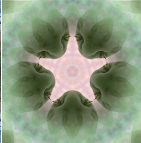
spirit of eden