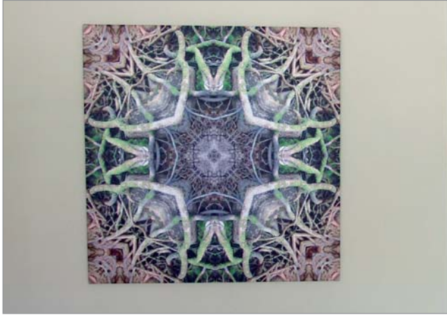
wurzeln & baumgeister