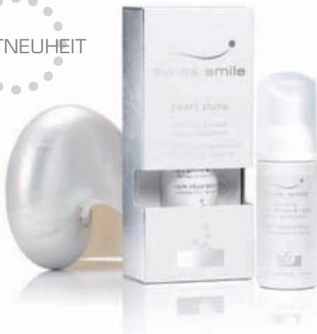
Pearl Shine Whitening & Repair Dental Conditioner