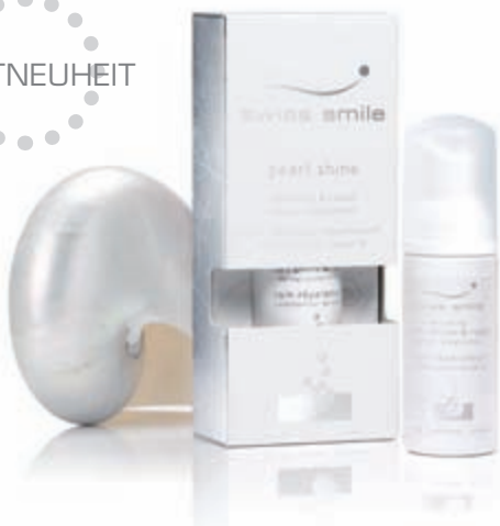
Pearl Shine Whitening & Repair Dental Conditioner