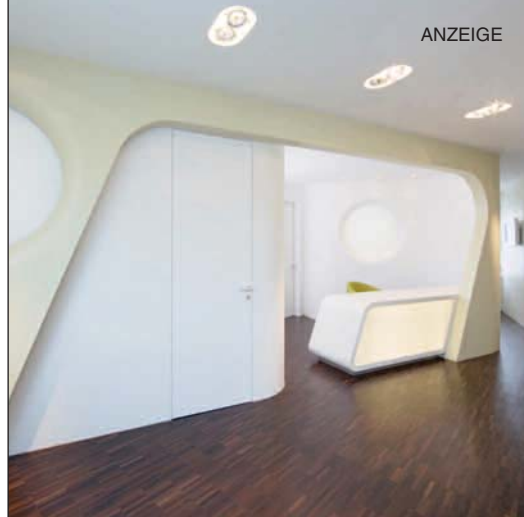
Räume für höchste Ansprüche

praxisdesign-online Tel.: 09 61/4 70 14 26 www.praxisdesign-online.de