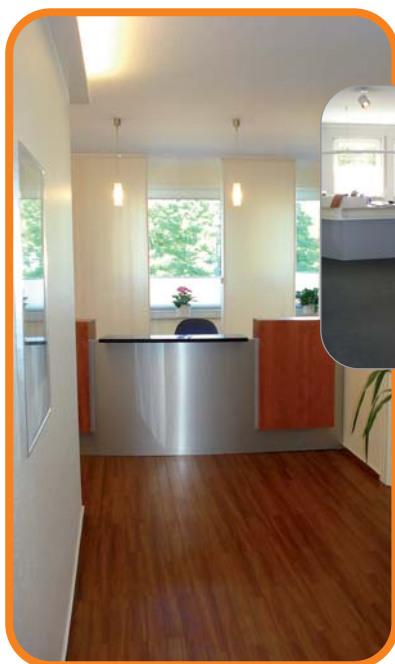
Großes Bild: Empfang nach Renovierung. – Kleines Bild: Empfang vor Renovierung.