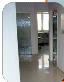
Kleines Bild: Flur vor Renovierung. Großes Bild: Flur nach Renovierung.