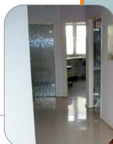
Kleines Bild: Flur vor Renovierung. Großes Bild: Flur nach Renovierung.