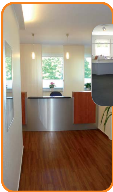
Großes Bild: Empfang nach Renovierung. – Kleines Bild: Empfang vor Renovierung.