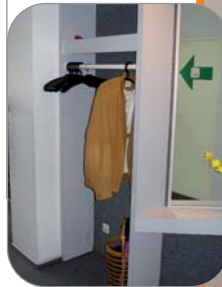
Kleines Bild: Garderobe vor Renovierung. – Großes Bild: Garderobe nach Renovierung.