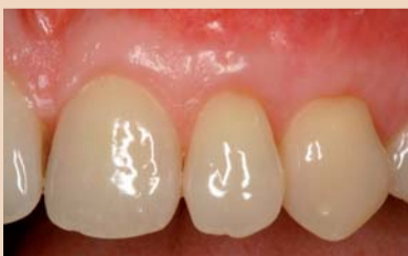
Abb. 2: Sechs Monate nach Anwendung der Tunneltechnik in Kombination mit Schmelzmatrix, Proteinen und einem Bindegewebs-Transplantat wurde eine vollständige Deckung der Rezessionen erreicht.

Wichtige Aspekte des Kurses stellten die praktischen Elemente wie die Schritt-für-Schritt-Darstellung der angewendeten Schnitt- und Nahttechniken sowie deren Integration in das gesamte Behandlungskonzept dar. Diese wurden in mehreren praktischen Übungen trainiert sowie anhand von Live-