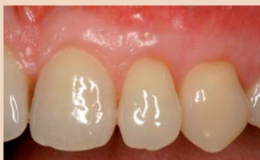
Abb. 2: Sechs Monate nach Anwendung der Tunneltechnik in Kombination mit Schmelzmatrix, Proteinen und einem Bindegewebs-Transplantat wurde eine vollständige Deckung der Rezessionen erreicht.

Wichtige Aspekte des Kurses stellten die praktischen Elemente wie die Schritt-für-Schritt-Darstellung der angewendeten Schnitt- und Nahttechniken sowie deren Integration in das gesamte Behandlungskonzept dar. Diese wurden in mehreren praktischen Übungen trainiert sowie anhand von Live-