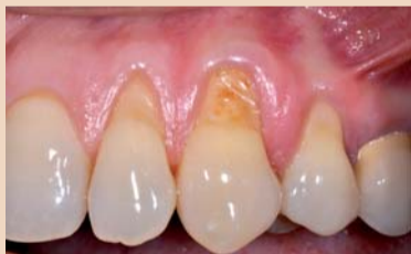
Abb. 1: Multiple Rezessionen als Folge kieferorthopädischer Therapie und traumatischer Zahnputztechnik.

Basierend auf vorhandener histologischer und klinischer Evidenz wurden die in der regenerativen und plastisch-ästhetischen Parodontaltherapie angewendeten Materialien und chirurgischen Techniken dargestellt und kritisch diskutiert.