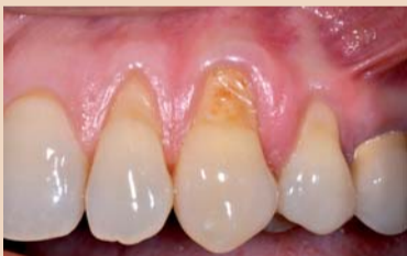
Abb. 1: Multiple Rezessionen als Folge kieferorthopädischer Therapie und traumatischer Zahnputztechnik.

Basierend auf vorhandener histologischer und klinischer Evidenz wurden die in der regenerativen und plastisch-ästhetischen Parodontaltherapie angewendeten Materialien und chirurgischen Techniken dargestellt und kritisch diskutiert.