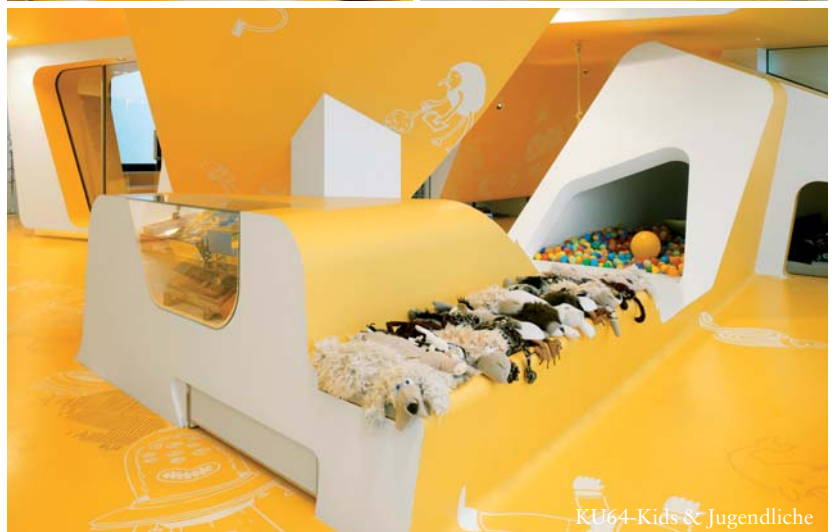
KU64-Kids & Jugendliche