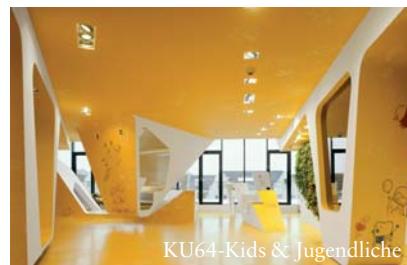
KU64-Kids & Jugendliche

Dr. Ziegler und Partner haben ihre bekannte Berliner Praxis um einen speziellen Kinderzahnarztbereich erweitert. Die sich über zwei Etagen erstreckende 1.500 m² große Praxis empfängt ihre Patienten mit sonnig-sandigen Farben und organisch geschwungenen Formen. Für die jungen Patienten wurde nun ein neuer Bereich eingerichtet, der sich am bewährten Design orientiert. So gibt es Sanddünen, die über eine eingelassene Spielandschaft mit Bällebad, Rutsche und Kletterwand verfügen. Ein deckenhängender Ko-