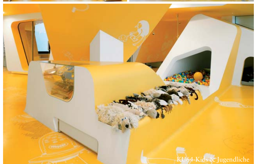
KU64-Kids & Jugendliche