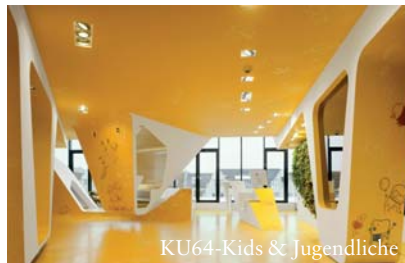
KU64-Kids & Jugendliche

Dr. Ziegler und Partner haben ihre bekannte Berliner Praxis um einen speziellen Kinderzahnarztbereich erweitert. Die sich über zwei Etagen erstreckende 1.500 m² große Praxis empfängt ihre Patienten mit sonnig-sandigen Farben und organisch geschwungenen Formen. Für die jungen Patienten wurde nun ein neuer Bereich eingerichtet, der sich am bewährten Design orientiert. So gibt es Sanddünen, die über eine eingelassene Spielandschaft mit Bällebad, Rutsche und Kletterwand verfügen. Ein deckenhängender Ko-