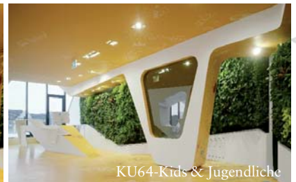
KU64-Kids & Jugendliche