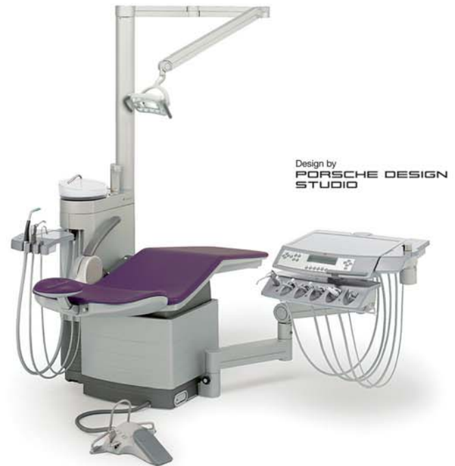
Design by PORSCHE DESIGN STUDIO