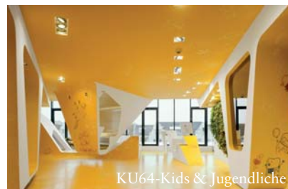
KU64-Kids & Jugendliche

Dr. Ziegler und Partner haben ihre bekannte Berliner Praxis um einen speziellen Kinderzahnarztbereich erweitert. Die sich über zwei Etagen erstreckende 1.500 m² große Praxis empfängt ihre Patienten mit sonnig-sandigen Farben und organisch geschwungenen Formen. Für die jungen Patienten wurde nun ein neuer Bereich eingerichtet, der sich am bewehrten Design orientiert. So gibt es Sanddünen, die über eine eingelassene Spielandschaft mit Bällebad, Rutsche und Kletterwand verfügen. Ein deckenhängender Ko-