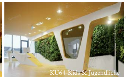
KU64-Kids & Jugendliche