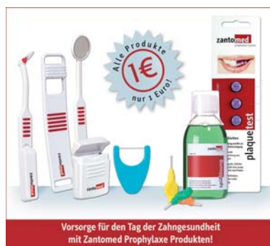
Vorsorge für den Tag der Zahngesundheit mit Zantomed Prophylaxe Produkten!

Diese Schnäppchenpreise kann jede Zahnarztpraxis in Deutschland oder