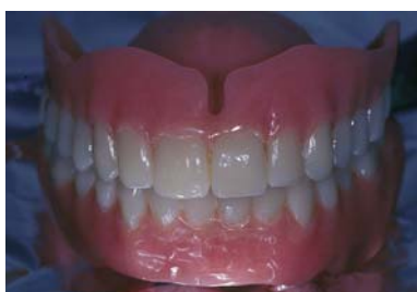
Abb. 5: Auch die konventionelle Totalprothetik ist nach wie vor beim älteren Menschen eine häufige Versorgungsart.

Generell muss man sagen, dass die konventionelle Totalprothetik zunehmend schwieriger und anspruchsvoller wird. Die Menschen verlieren meist erst im höheren Lebensalter vollständig ihre Zähne und werden das erste Mal in einem Alter mit bereits verminderter