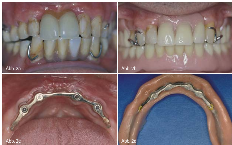
Abb. 2a: Insuffiziente Ausgangssituation bei einem 75-jährigen Patienten mit zahlreich fehlenden Zähnen. – Abb. 2b: Zustand am Behandlungsende mit einer Modellgussprothese im Oberkiefer und einer implantatgestützten Hybridprothese im Unterkiefer. – Abb. 2c: Gefräster Steg auf vier interforaminalen Implantaten. – Abb. 2d: Hybridprothese mit Metallmatrize und Variosoft-Geschieben von bredent.

Neben den Möglichkeiten, die implantatverankerte Hybridprothesen bieten (Grunert und Norer 2001), sollte man speziell bei älteren, nicht mehr gesunden Patienten auf die Verankerungsmöglichkeit des herausnehmbaren Zahnersatzes auf Wurzelkappen nicht vergessen. Mit unterschiedlich gestalteten Retentionselementen kann mit einfachen prothetischen Maßnahmen