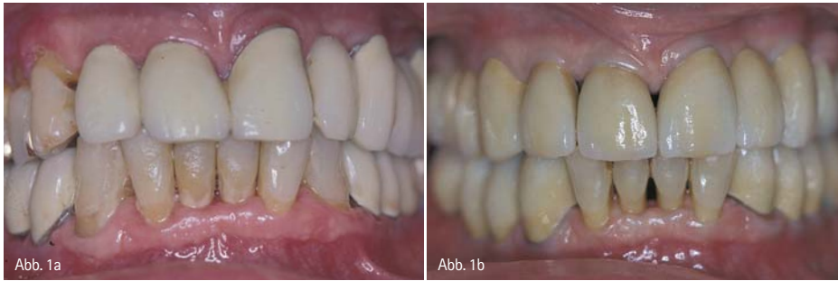
Abb. 1a und 1b: 78-jähriger Patient mit seiner alten Versorgung sowie nach parodontaler Vorbehandlung und festsitzender Neuversorgung.

zes sehr wichtig ist. Für diese Patienten ist es auch wichtig, dass sie, wenn möglich, festsitzend versorgt werden. Die Kosten des Zahnersatzes spielen meist keine entscheidende Rolle.