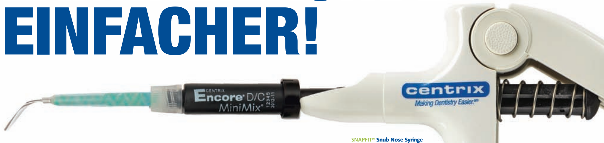
SNAPFIT ® Snub Nose Syringe