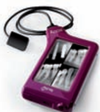
X-pod Wireless Digital System

MyRay hat aus gutem Grunde eine liegende Patientenpositionierung gewählt, für einen komplett entspannten Patienten und eine damit verbundene natürliche Immobilität, Grundvoraussetzung für eine einwandfreie extraorale 3D Aufnahme.