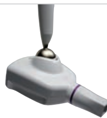
RXDC HyperSphere High frequency X-ray unit