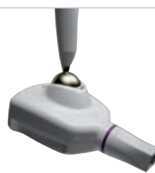
RXDC HyperSphere High frequency X-ray unit