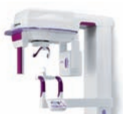
Hyperion Panoramic Imager