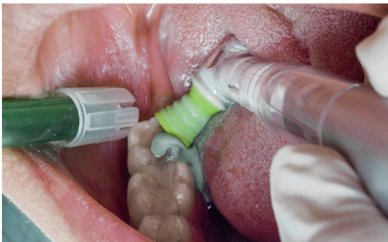
Abb. 4: Auch schwer zugängliche Bereiche werden gut erreicht.