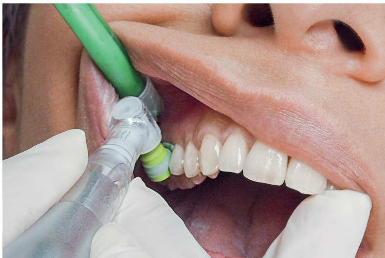
Abb. 2: Die Kelche erreichen auch die Zahnzwischenräume und die Noppen reinigen gleichzeitig benachbarte Zähne und vermindern außerdem das Wegspritzen der Paste.

Die Steuerung des Proxeo TWIST Cordless ist ganz einfach mittels einer kabellosen Fußsteuerung und einem Knopf am Handstück möglich. Das Design ist einfach und passt ideal zu den Bedürfnissen des Prophylaxepolituralltags. Die Betriebsfunktionen werden über ein Ampelsystem gesteuert und sind spielend einfach zu verstehen. Auch um die Akkuleistung muss sich keine Sorgen gemacht werden, denn der Li-Ionen-Akku hält problemlos für acht bis zwölf Patienten. Der kabellose Fußanlasser verfügt über eine Akkulauf-