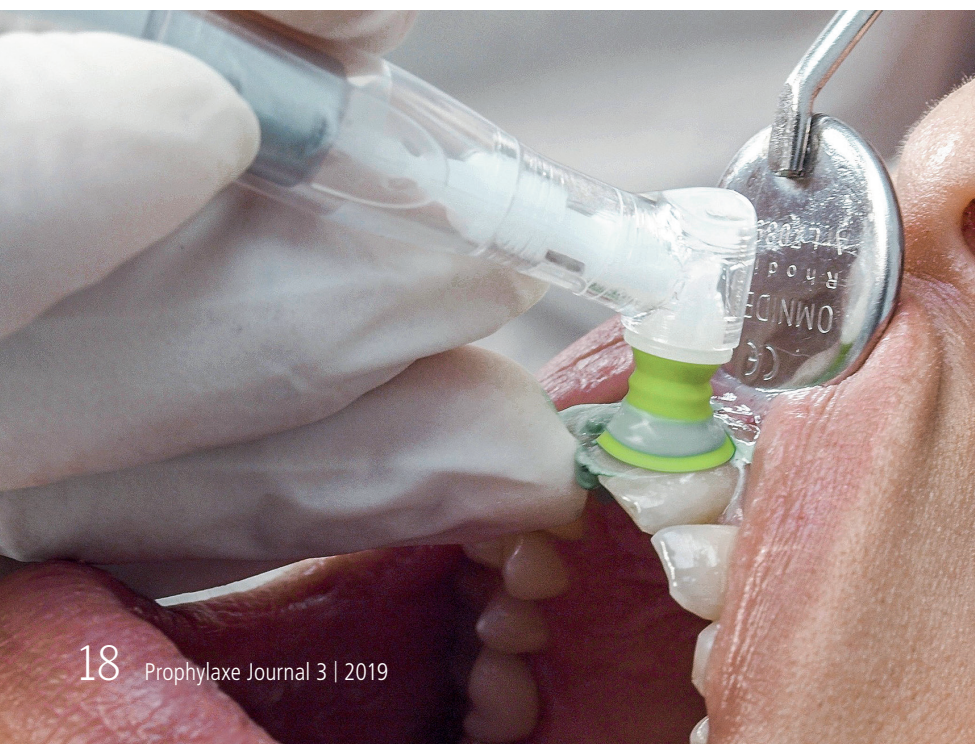
Abb. 1: Die Adaptation der Kelche an die Zahnoberfläche ist sehr gut und die dünnen, noppenlosen Ränder der Kelche machen die Reinigung im Sulkusbereich angenehm. Das transparente Design der Einwegwinkelstücke wirkt hygienisch.

Darüber hinaus sind die Prophy-Kelche sehr widerstandsfähig, stabil, fransen nicht aus und das Material weist eine konstant gute Qualität auf. Die Noppen an der Außenseite der Polierkelche vermindern das Wegspritzen der Paste (Abb. 2). Die zwei verschiedenen Härtegrade der Polierkelche erlauben es, auf die Bedingungen im jeweiligen Patientenfall einzugehen. Das transparente Design der Einwegwinkelstücke macht einen hygienischen Eindruck (Abb. 1 und 2). Eine minimalinvasive Behandlung wird ebenfalls durch op-