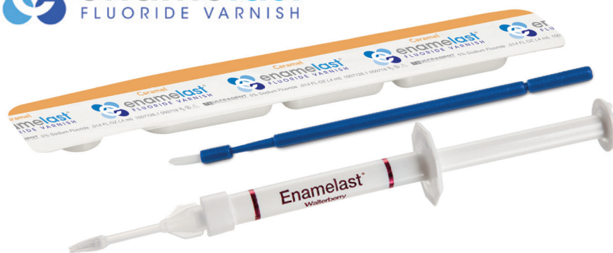
Abb. 2: Der fünfprozentige Natriumfluoridlack Enamelast™ zur Behandlung von Zahnhypersensibilität und zur Kariesprophylaxe ist als Spritze in der Geschmacksrichtung Walterberry erhältlich sowie als Unit-Dose in Walterberry, Orange Cream, Cool Mint, Bubble Gum und neu in Caramel.