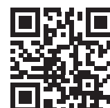
[Infos zum Unternehmen]

dental bauer GmbH & Co. KG Tel.: 07071 9777-0 prokonzept@dentalbauer.de www.dentalbauer.de