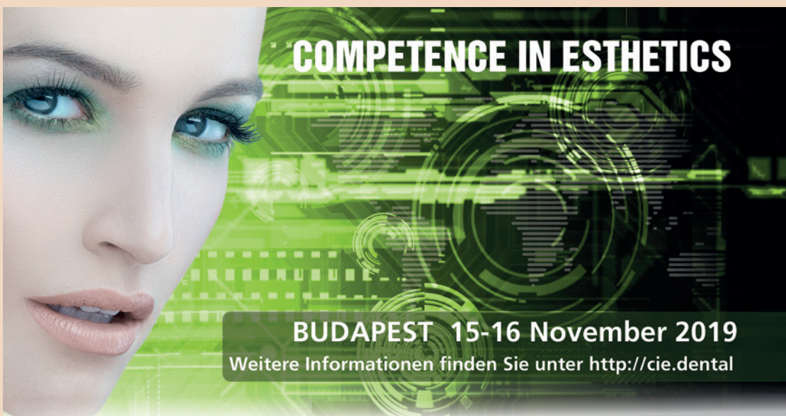
Competence in Esthetics Symposium, das Highlight für Zahnärzte und Zahntechniker in der Region.