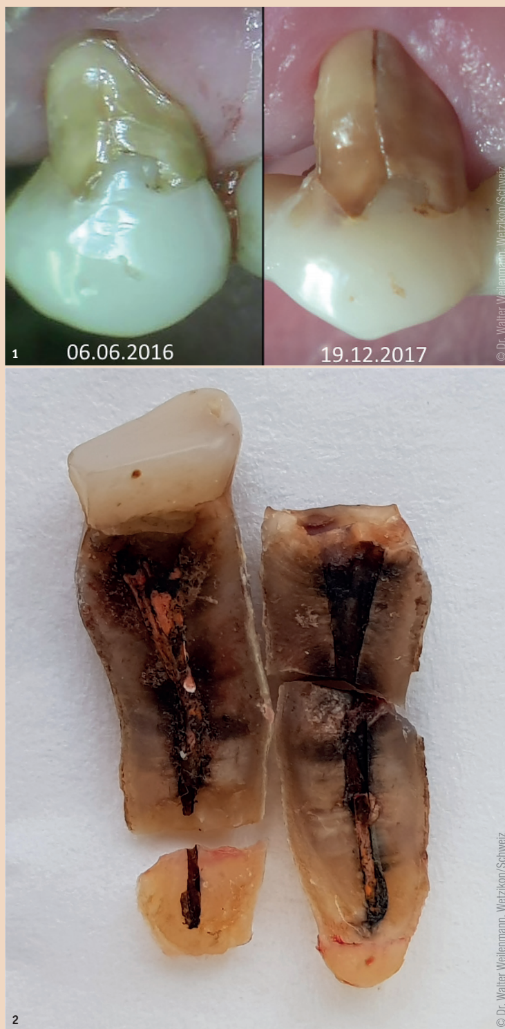
Abb. 1: Entwicklung eines Microcracks zur Vertikalfraktur. – Abb. 2: Degradierte Wurzelkanalfüllung: Ursache oder Folge der Vertikalfraktur?

Ein weiterer entscheidender Faktor neben der Wurzelkanalbehandlung ist die Art der endgültigen Versorgung endodontisch behandelte Zähne, insbesondere der