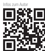
Infos zum Autor

Komet Dental Gebr. Brasseler GmbH & Co. KG Trophagener Weg 25 32657 Lemgo Tel.: 05261 701-700 info@kometdental.de www.kometdental.de