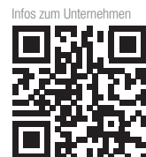
Infos zum Unternehmen