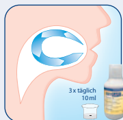
Fortsetzung der Behandlung durch den Patienten zuhause