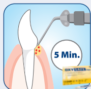
Direkte Applikation in die Zahnfleischtasche