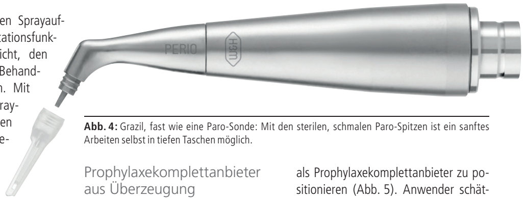
Abb. 4: Grazil, fast wie eine Paro-Sonde: Mit den sterilen, schmalen Paro-Spitzen ist ein sanftes Arbeiten selbst in tiefen Taschen möglich.

Hervorzuheben ist bei den Sprayaufsätzen die 360 Grad-Rotationsfunktion, welche es ermöglicht, den Aufsatz dynamisch an die Behandlungsposition anzupassen. Mit den speziellen Paro-Sprayaufsätzen (Abb. 4) und den um 90 bzw. 120 Grad gewinkelten Sprayaufsätzen in zwei verschiedenen Längen sind Praxen auch für schwer zugängliche Stellen bestens gerüstet. Natürlich wurde bei der Produktentwicklung auch an effiziente Hygiene gedacht. Das Handstück kann einfach wischdesinfiziert werden, die abnehmbaren Sprayaufsätze sind thermodesinfizierbar und sterilisierbar.