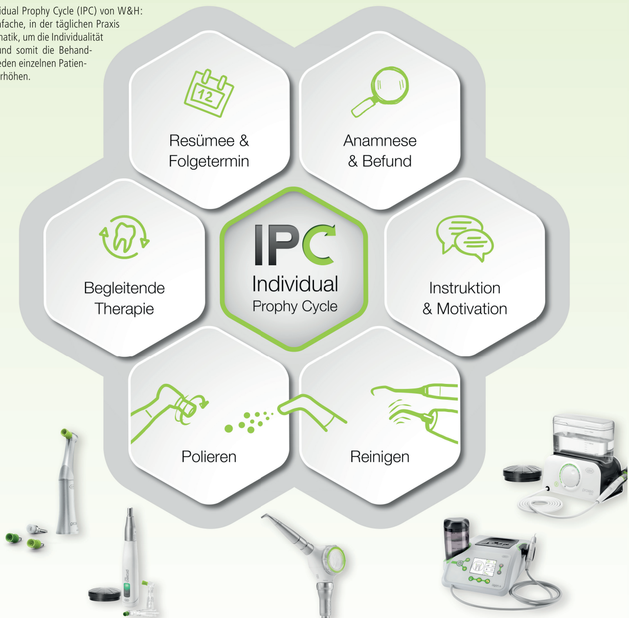
Abb. 5: Der Individual Prophy Cycle (IPC) von W&H: Er schafft eine einfache, in der täglichen Praxis umsetzbare Systematik, um die Individualität der Behandlung und somit die Behandlungsqualität für jeden einzelnen Patienten nachhaltig zu erhöhen.

Das Motto „Proxeo – Prophy for Professionals“ steht stellvertretend für das,