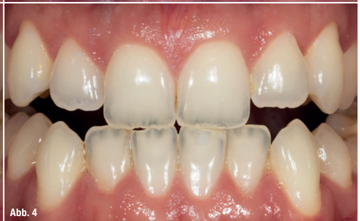
Abb. 1–4: Situation vor (Abb. 1 und 3) und nach (Abb. 2 und 4) der Anwendung von White.