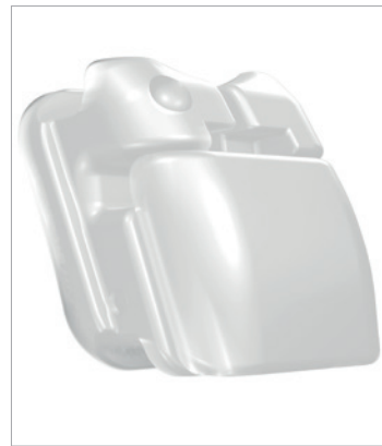
3M Clarity Ultra SL Selbstligierendes Keramikbracket.

Weitere Informationen für Anwender sind unter www.3M.de/OralCare unter dem Reiter „Kieferorthopädische Produkte“ erhältlich. Die Patientenflyer können beim 3M Customer Service unter der Rufnummer 08191 9474-5000 kostenfrei bestellt werden.