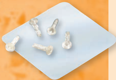
Membrane und Pins aus PDLLA