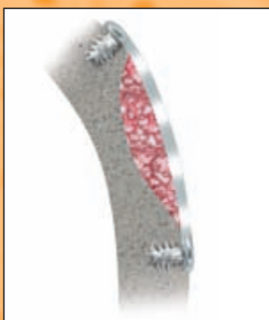
Schalentechnik mit 0,1 mm PDLLA-Folie