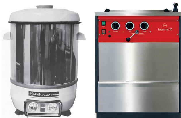
Abb. 2a und b