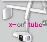
x-on ® tube AIR