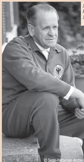
Mit seiner Weisheit „Nach dem Spiel ist vor dem Spiel.“ hätte Sepp Herberger auch Dentalfachperson oder Messeleiter werden können.