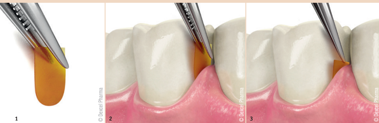
Abb. 1–3: Die Applikation des antibakteriellen Wirkstoffs Chlorhexidinbis(D-gluconat) in Form eines 2,5 mg Matrix-Gelatine-Inserts für Parodontaltaschen (PerioChip, Dexcel Pharma).

Langfristige Behandlungserfolge bei der unterstützenden Parodontitistherapie.