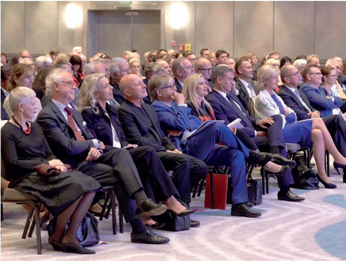
▲ Blick beim Festakt im Jahr 2018 vom Rednerpult aus auf die erste Reihe mit Festrednern und Ehrengästen.