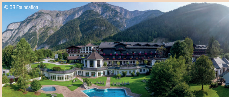
Veranstaltungsort des SIT 019: das Hotel Gut Brandlhof in der Pinzgauer Alpenregion.

Vom 10. bis 12. Oktober 2019 findet das SIT 019 in der Pinzgauer Alpenregion statt.