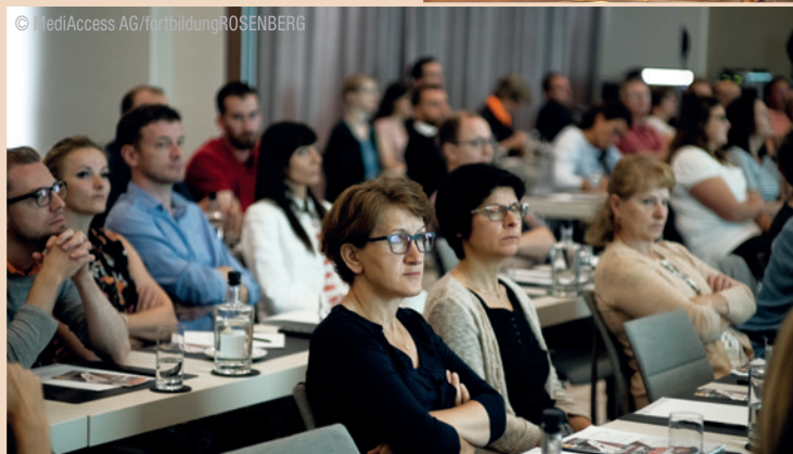
Zufriedene Teilnehmer bei der Veranstaltung in Berlin.

bekannte Gesichter – Zahnärzte, die schon im vergangenen Jahr dabei waren.