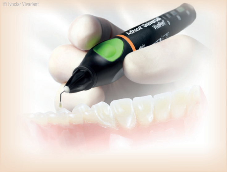
Das Ein-Komponenten-Adhäsiv Adhese Universal von Ivoclar Vivadent.

hohe Haftwerte auf Schmelz und Dentin, unabhängig vom verwendeten Ätzprotokoll. Zudem kann Adhese Universal – durch den Einsatz eines acetonfreien, hydrophilen Lösungsmittels – Dentin und Schmelz optimal benetzen. Es dringt in die Dentintubuli ein und versiegelt sie, Flüssigkeitsbewegungen in den Tubuli und das Risiko der damit in Zusammenhang stehenden postoperativen Sensibilitäten werden minimiert.