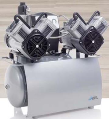
Ölfreier Dürr Dental Kompressor, Baujahr 1965

Leistungsstarke Dürr Dental Kompressoren für hervorragende Luftqualität im Dauerbetrieb gelten seit Jahrzehnten als das Herz der Praxis. Dies und innovative Entwicklungen, wie die Membran-Trocknungsanlage, machen den Kompressor immer aufs Neue zur ersten Wahl für Generationen von Zahnärzten. Mehr unter www.duerrdental.com