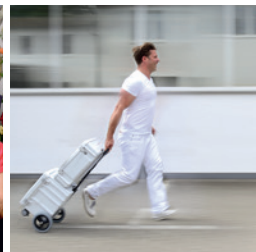
Portables Set SMART-PORT Premium