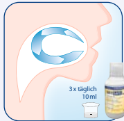
Fortsetzung der Behandlung durch den Patienten zuhause