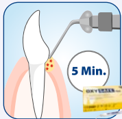
Direkte Applikation in die Zahnfleischtasche