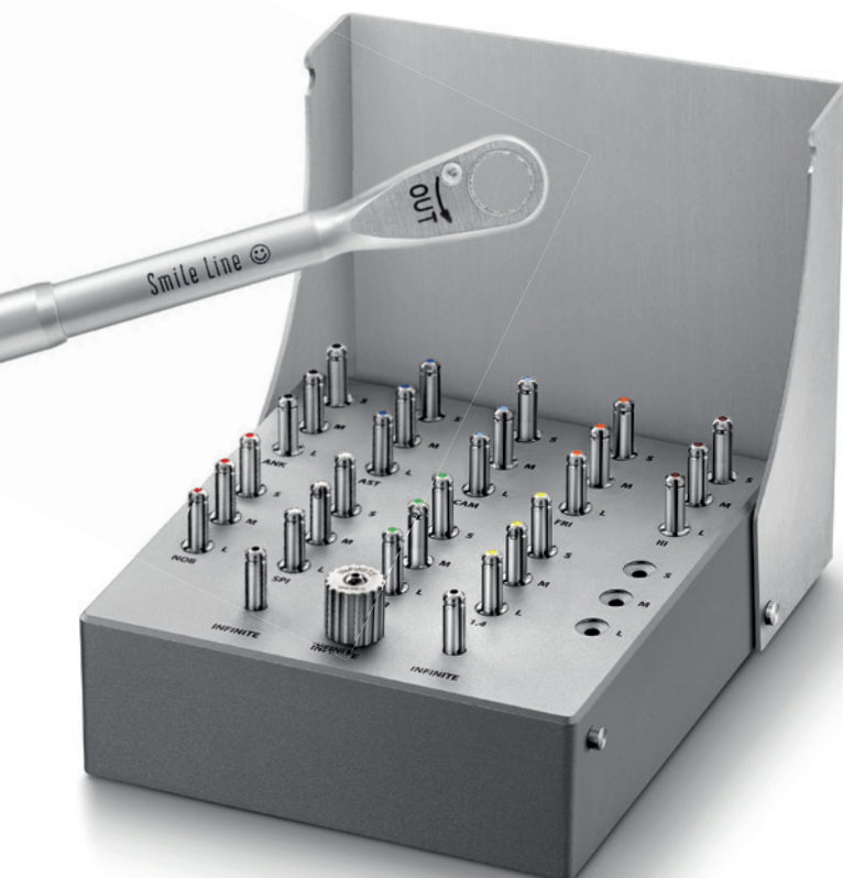
Das Implantat-Schraubendreher-Set SIDEKICK gehört zu den Neuheiten von Smile Line Europe. Der entsprechende Drehmomentschlüssel ist enthalten.