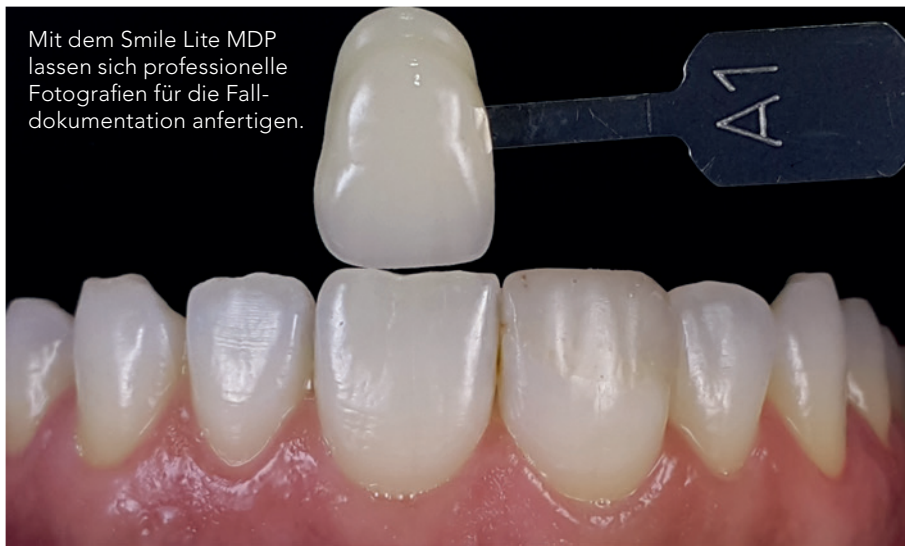
Mit dem Smile Lite MDP lassen sich professionelle Fotografien für die Falldokumentation anfertigen.