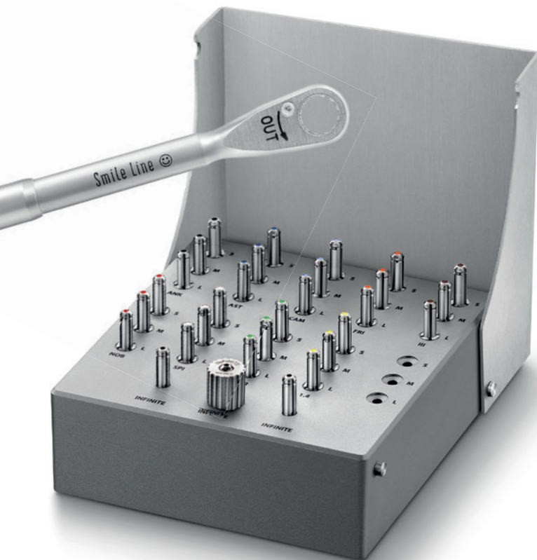
Das Implantat-Schraubendreher-Set SIDEKICK gehört zu den Neuheiten von Smile Line Europe. Der entsprechende Drehmomentschlüssel ist enthalten.