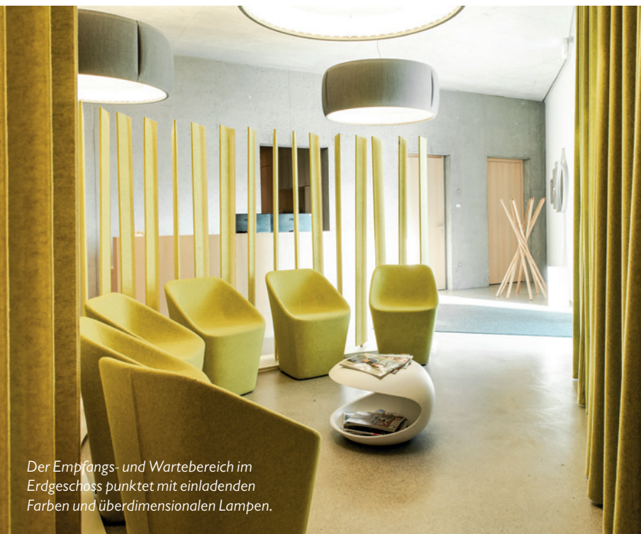
Der Empfangs- und Wartebereich im Erdgeschoss punktet mit einladenden Farben und überdimensionalen Lampen.