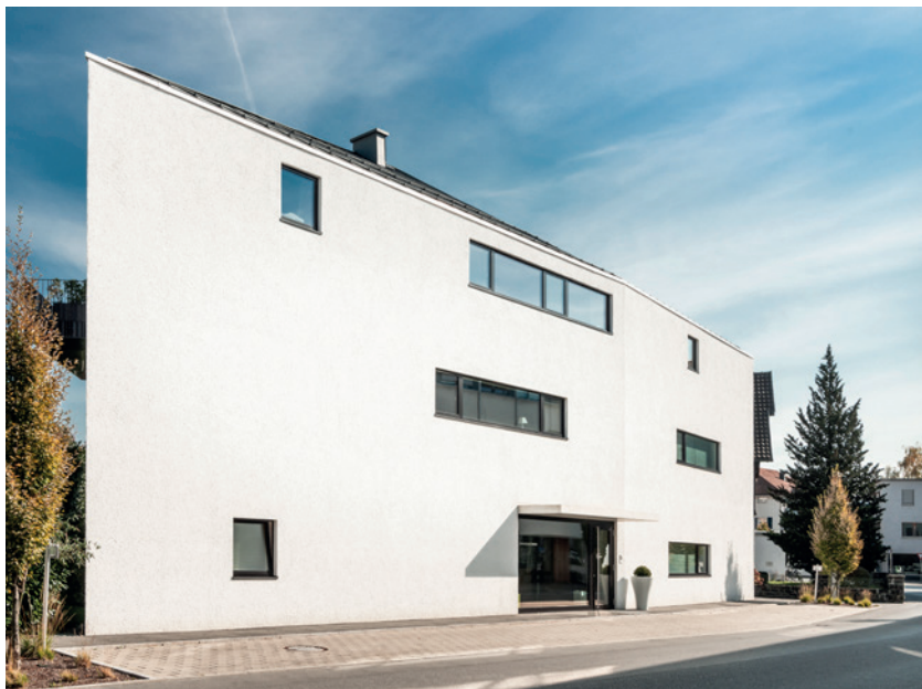
Abbildung oben: Straßenseitig fällt die urbane Fassade des Wohn- und Geschäftshauses auf, das Kundenparkplätze direkt vor der Ordination bietet.