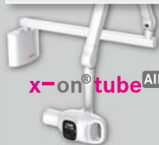
x-on ® tube AIR