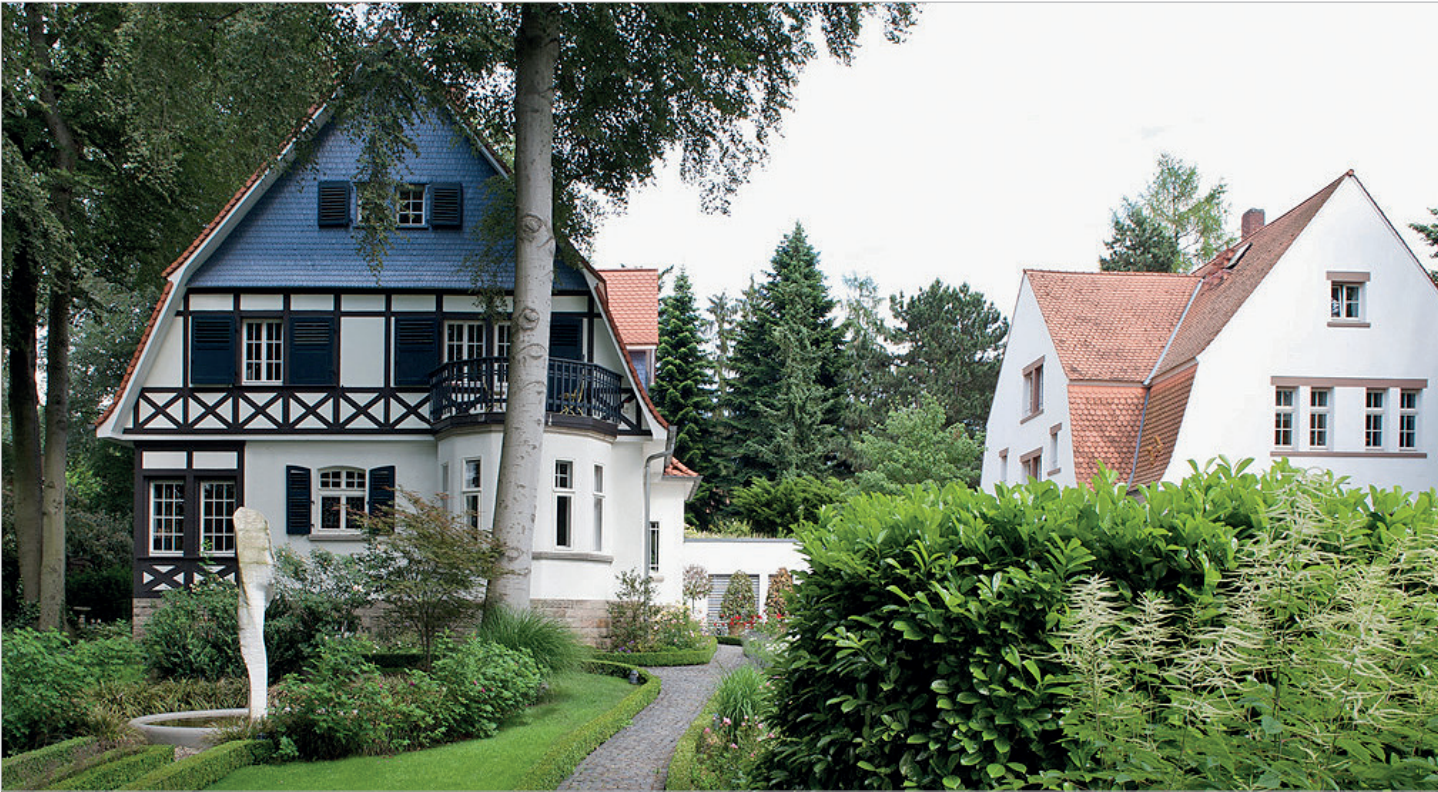
Abb. 2: Rosenpark Klinik in den beiden Jugendstilvillen, umgeben von einem liebevoll gepflegten Park.

mehr als 28.000 erfolgreich durchgeführten Körperformungsbehandlungen (größtenteils Liposuktionen/Fettabsaugungen in Tumescenz-Lokalanästhesie) und über 78.000 Gesichtsverjüngungsmaßnahmen einen maximalen Erfahrungsschatz. Die Ärzte tauschen sich zudem intensiv untereinander aus und bilden sich kontinuierlich weiter, um ihre jeweiligen Spezialgebiete weiter zu verfeinern. Damit können jedem Patienten stets die qualitativ hochwertigsten und sichersten Behandlungsmethoden einer seriös angewandten Ästhetischen Medizin angeboten werden. Denn: Ein ästhetischer Eingriff ist Vertrauenssache und darf die Gesundheit des Patienten nicht gefährden.