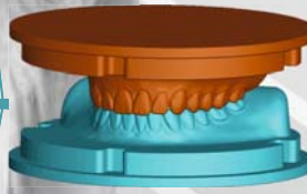
Baltic Denture System