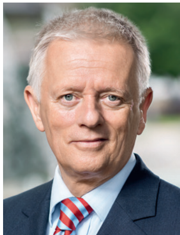
Fritz Kuhn Oberbürgermeister der Stadt Stuttgart

Liebe Besucherinnen und Besucher, sehr geehrte Aussteller,