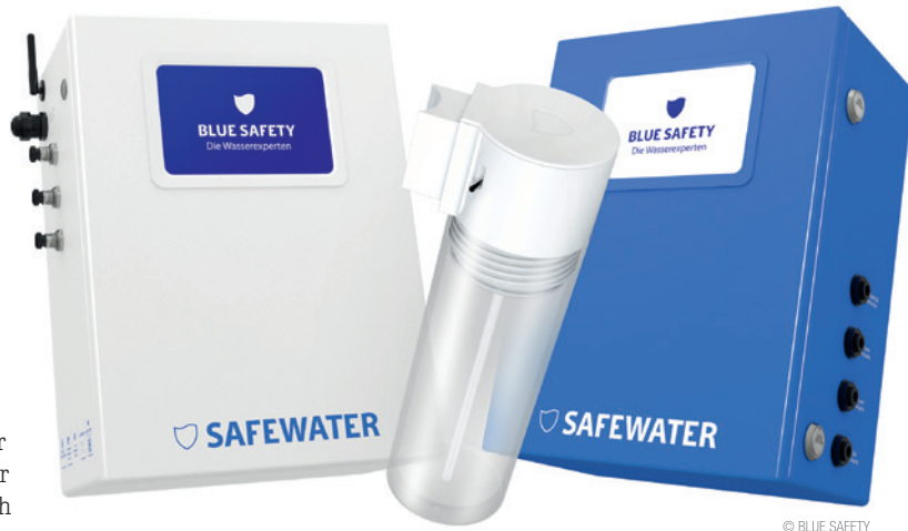
Biozidprodukte vorsichtig verwenden. Vor Gebrauch stets Etikett und Produktinformation lesen.

Der exklusive Premium-Partner des Deutschen Zahnärztes für den Bereich Praxishygiene hat sich inzwischen seit fast zehn Jahren der Wasserhygiene in der Dental-