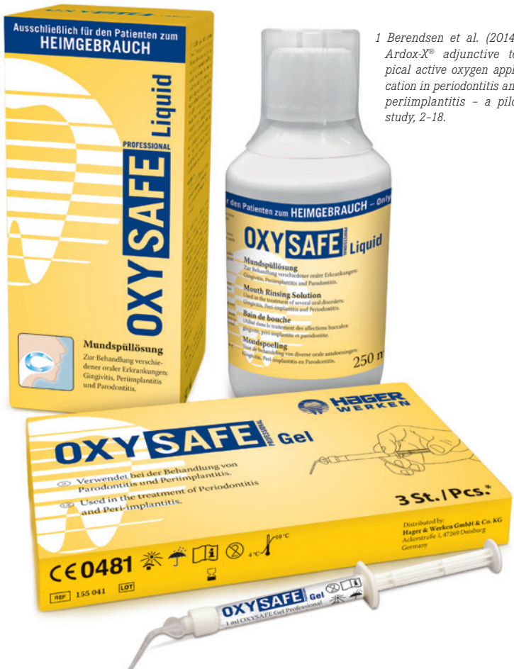
1 Berendsen et al. (2014): Ardox-X® adjunctive topical active oxygen application in periodontitis and periimplantitis - a pilot study, 2-18.

Bewusst wurde auf körperschädigende Inhaltsstoffe, wie z. B. Wasserstoffperoxide und Radikale, verzichtet. Die Applikation von OXYSAFE Gel Professional unterstützt die parodontale Regenerationstherapie von Weichgewebe, das durch Periimplantitis geschädigt wurde. OXYSAFE Professional wirkt sowohl antibakteriell als auch antifungizid und unterstützt durch seinen erhöhten Sauerstoffanteil die Regeneration von entzündetem Gewebe. Es schützt die Mundflora und verursacht keinen Zelltod bei Erythrozyten oder Leukozyten. Ebenso werden weder Mukosazellen noch Osteoblasten angegriffen (Berendsen et al. 2014). 1 «