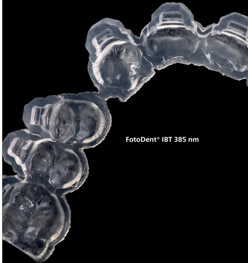
FotoDent® IBT 385 nm

Lichthärtender Kunststoff zur Herstellung von transparenten, kieferorthopädischen Übertragungsschienen mittels 385 nm-LED-basierter Stereolithographieverfahren. Überprüfung der korrekten Bracketpositionen jederzeit möglich - vor und nach dem Verkleben. Zur obligatorischen Nachhärtung von mit FotoDent® IBT gefertigten Bauteilen empfehlen wir das Hochleistungslichthärtengerät PCU LED N 2 - für Bauteile ohne Inhibitionschicht.