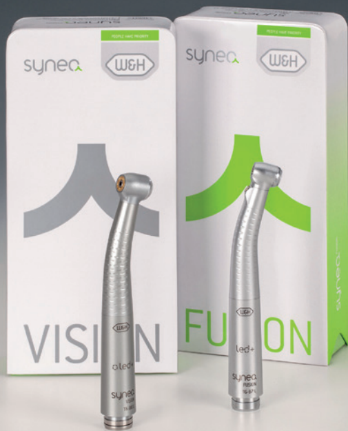
Abb. 4: Synea Vision: Die Ausstattungslinie für höchste Ansprüche. Maßgeschneiderte Hand- und Winkelstücke von höchster Präzision, Eleganz und Leistung. Synea Fusion: Die effiziente und ökonomische Basislösung in bewährter Synea-Qualität.

Gibt es ein besonderes Patientenerlebnis mit Synea, das Ihnen in Erinnerung geblieben ist?