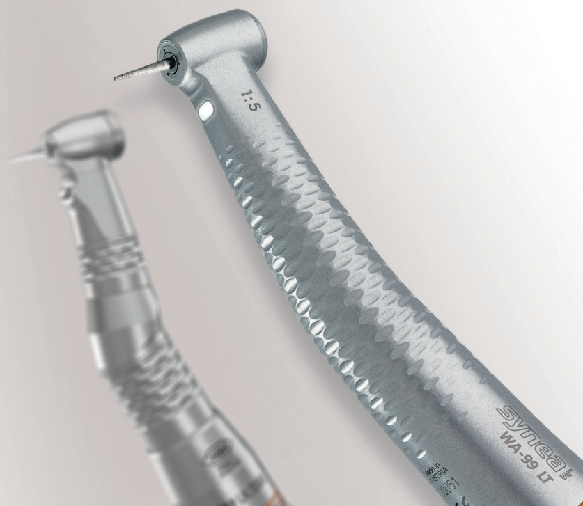
Abb. 2: Schon die erste Synea-Generation überraschte 1998 mit Eleganz und schlankem Monobloc-Design.

zung auffällig unauffällig. Das Winkelstück macht einen sehr soliden und stabilen Eindruck und zeigt eine optimale Lauf-ruhe in jedem Drehzahlbereich. Auch bei längerer Benutzung neigt es nicht zur Überhitzung oder Schwergängigkeit. Die Wasserkühlung ist präzise platziert und ausreichend dimensioniert. Bei guter Wartung und Pflege beeindruckt die Langlebigkeit.