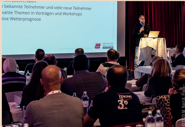
Die DKOI veranstaltet vom 25. bis 29. März 2020 zum 15. Mal ihr Wintersymposium in Zürs am Arlberg, dann unter dem neuen Namen ImpAct Zürs Austria.

„Je tiefer wir ein Verständnis für reparative und regenerative Vorgänge forschend und empirisch entwickeln, umso genauer werden wir die Möglichkeiten und Grenzen unseres Tuns ausloten und auf das gewünschte therapeutische Er-