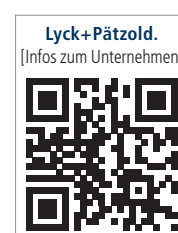
Lyck+Pätzold. [Infos zum Unternehmen]