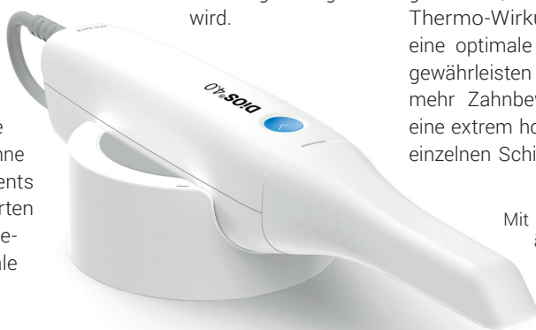
Mit dem DiOS 4.0® lässt sich nicht nur eine sehr schnelle, sondern äußerst präzise intraorale Abformung realisieren – und das bei hoher Tiefenschärfe und exzellenter Detailtreue.

Gutenbergstraße 9–11 82205 Gilching Tel.: 08105 73436-0 Fax: 08105 73436-22 service@adenta.com www.adenta.de