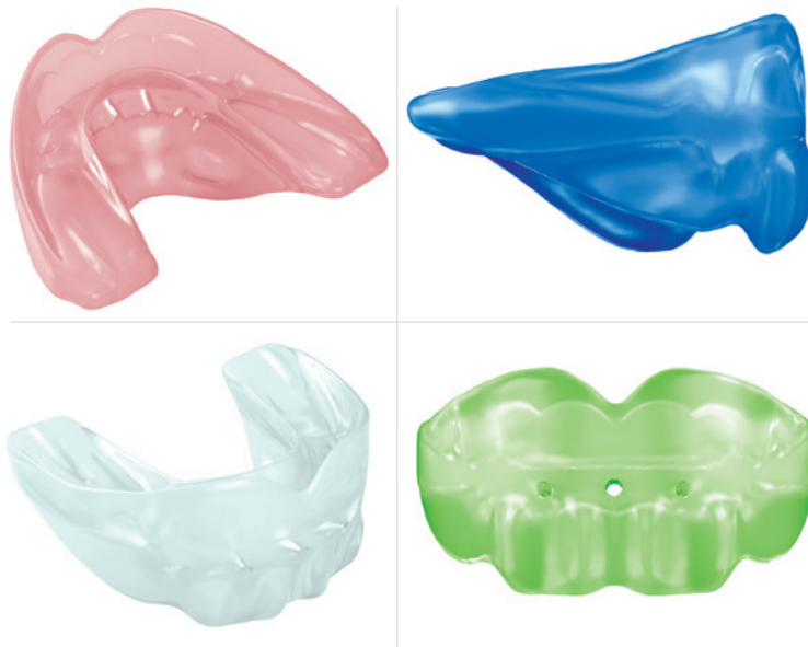
Die U Concept® Apparaturen können bei sämtlichen Fehlstellungen in allen Altersgruppen eingesetzt werden. Sie sind in verschiedenen Farben beziehbar.

U Kiddy ist z.B. für Kinder ab drei Jahren gedacht und kann bis zum Durchbruch der Sechsjahrmolaren eingesetzt werden. Er wirkt Daumenlutschen, Finger- oder Lippensaugen entgegen und verbessert das Atmen, Schlucken oder Kauen. Dies wird u.a. durch