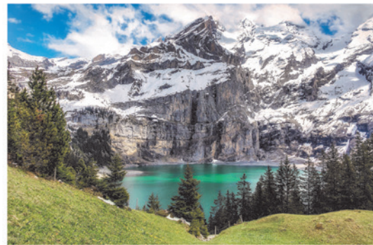
SWISS BIOHEALTH EDUCATION 1. Halbjahr 2020

SDS Swiss Dental Solutions AG www.swissdentalsolutions.com