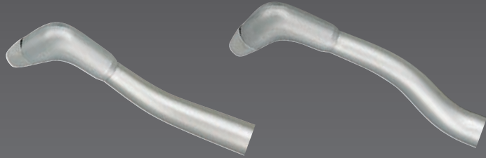
Düsen mit 60° und 80° in dem Set enthalten