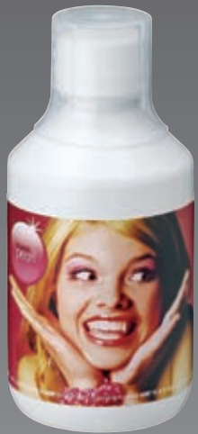
FLASH pearl Flaschen 4 x 300-g-Flaschen 77,- €*