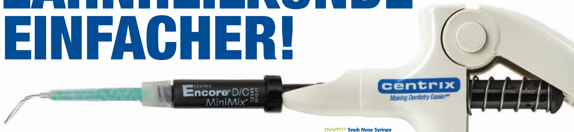
SNAPFIT ® Snub Nose Syringe