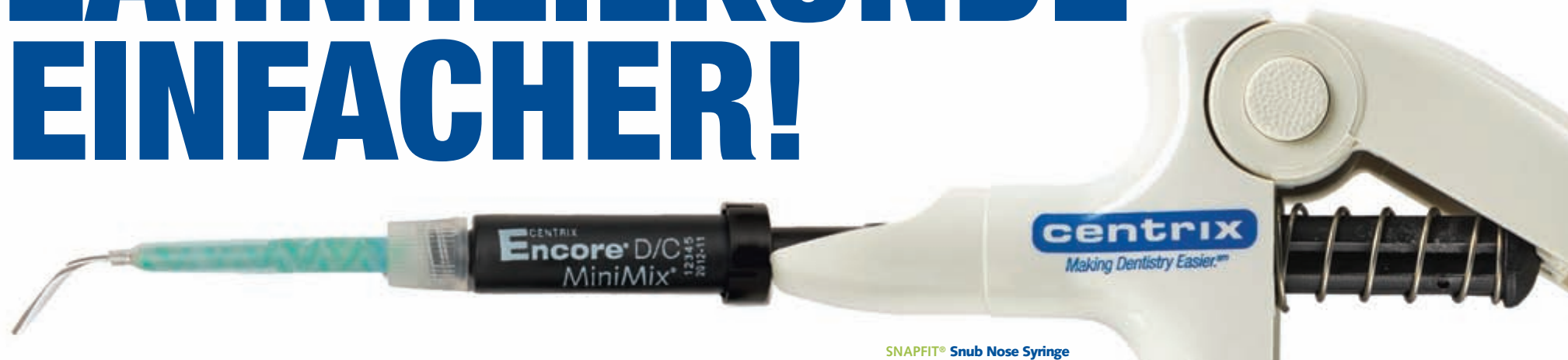
SNAPFIT ® Snub Nose Syringe