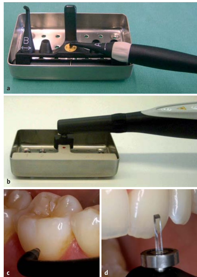
Abb. 3: Kalibrierungsvorgang: a) und b) Standardkalibrierung; c) und d) Individuelle Kalibrierung mit dem DIAGNOdent (Okklusalspitze) bzw. dem DIAGNOdent pen (keilförmige Spitze für approximal).

Rodrigues et al. verglichen verschiedene Methoden zur Kariesdetektion bei Okklusalflächen. 25 DIAGNOdent zeigte eine höhere Spezifität und eine geringere Sensitivität als die von Lussi und Hellwig gefundenen Werte, 18 während DIAGNOdent pen eine geringere Spezifität und praktisch die gleiche Sensitivität im Vergleich zu diesen Werten zeigte. Ein anderer Vergleich des DIAGNOdent mit visueller und radiologischer Beurteilung wurde neulich in vivo durchgeführt. Die Autoren schlussfolgerten, dass er eine sinnvolle Ergänzung zur visuellen Untersuchung darstellt, da seine di-