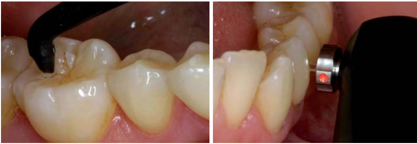
Abb. 4: Messung einer Okklusalfäche mit dem DIAGNOdent. – Abb. 5: Messung einer approximalen Zahnfläche mit dem DIAGNOdent pen. (Abbildung aus Neuhaus et al.) 20

agnostische Effizienz gut geeignet zur Erkennung okklusaler Karies zu sein schien. 3 Eine andere In-vivo-Studie demonstrierte, dass das Gerät auch zum Auffinden von Dentinkaries geeignet ist. 10