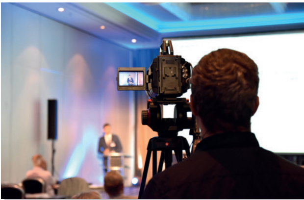
Kameramann filmt im Podium

Das Live-Kongress-Streaming von Vorträgen oder ganzen Kongressen bietet die Gelegenheit, die Reichweite über den Kongress hinaus deutlich zu erweitern und bei Bedarf zu internationalisieren. Die Außenwirkung wird erhöht und ein deutlicher Mehrwert generiert.