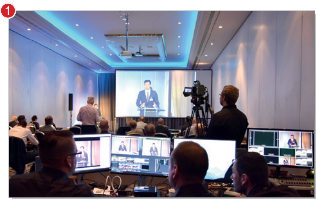
Regie im Podium

② Die Bildkanäle werden über die Regie gesteuert. So sind wechselnde Ansichten und Bild-in-Bild-Darstellung möglich. Eine Chatfunktion kann auf Wunsch ebenfalls eingebunden werden.