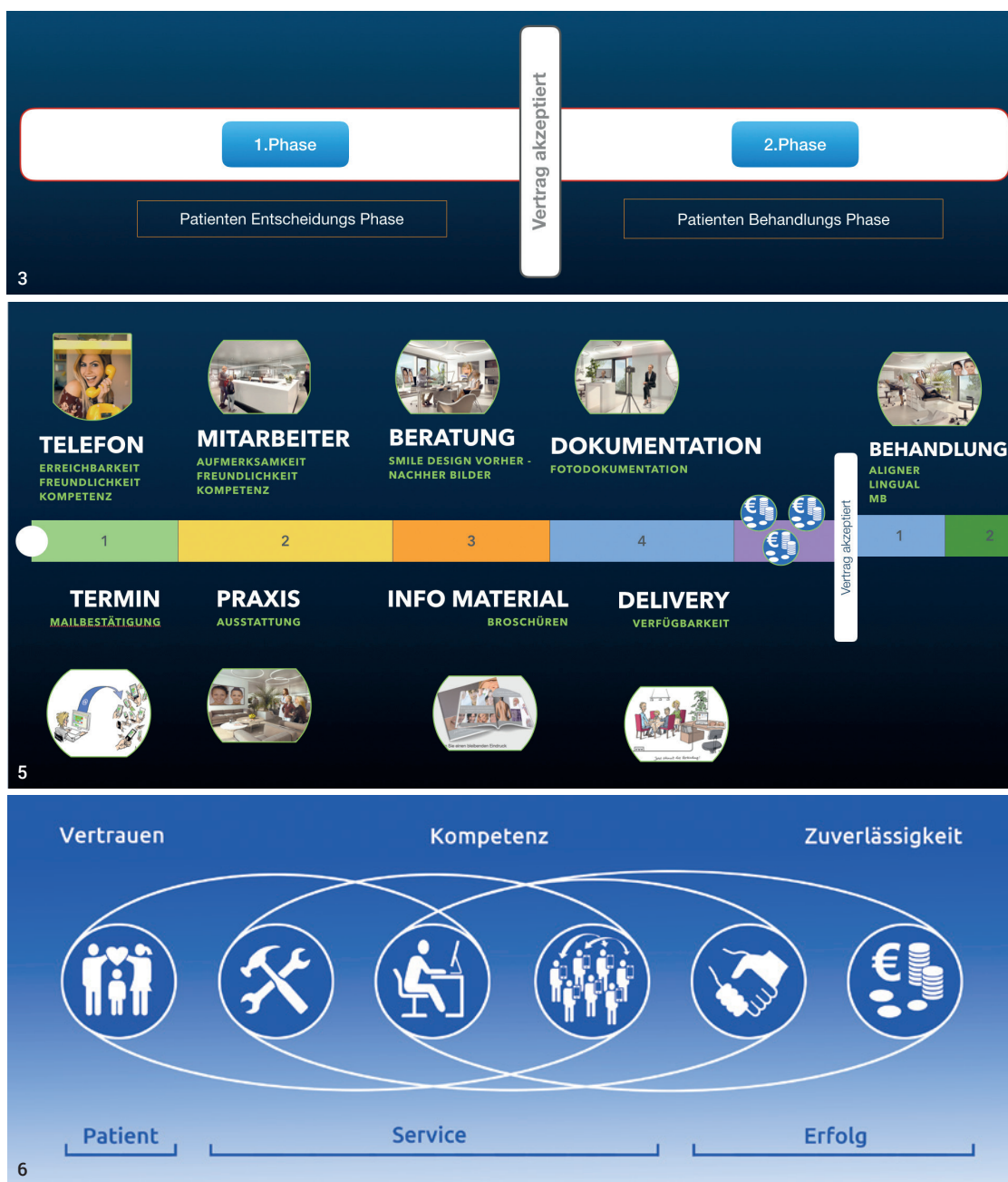
Abb. 3: Die beiden Phasen des Entscheidungszyklus eines Patienten. Abb. 5: Eckpunkte für eine erfolgreiche Phase 1. Abb. 6: Die erste Phase des Entscheidungszyklus stellt ein hochkomplexes System wechselseitiger Wirkung dar. Abb. 7: Das Team von iie-systems steht im entsprechenden iie-Blog gern mit Rat und Tat zur Seite.