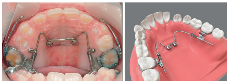
Für die paramediane Insertion bietet dentalline im Herbst ein BENEslider® Standard-Komplettset zum attraktiven Sonderpreis an.

Der Aufbau, der über die dentalline GmbH exklusiv in Deutschland, Österreich und der Schweiz erhältlichen Apparatur, basiert auf zwei im Gaumen inserierten BENEFit®-Miniimplantaten, auf die eine BENEplate® mit Draht ge-